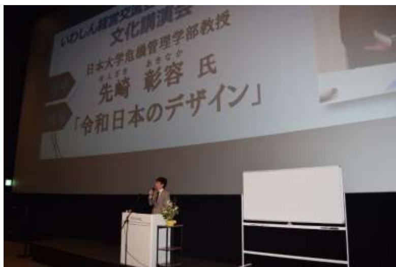
<文化講演会の様子>