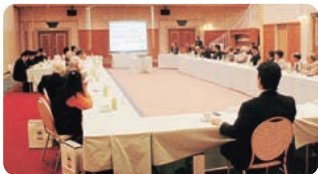
③日 時 平成22年 5月18日 11時半より 場 所 八幡台やまたまや 出席者 総代27名 信用組合役職員14名