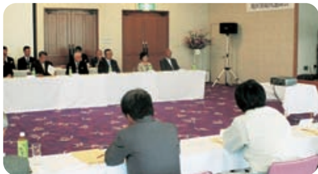
①日 時 平成22年 5月11日 11時半より 場 所 太平洋健康センター 出席者 総代28名 信用組合役職員15名

ガバナンスの機能強化に向けた一環として、4班に分けて総代会開催日前に毎年実施し、今年で6年目を迎えております。当組合の経営実態や金融機関からみた地域経済の現況と海外の動向をわかり易く説明、また一方、各地区総代よりは利用者側の視点よりの発言をいただき、経営に反映させております。実例として「地域安全パトロール」「子どもひなんの家」の活動が生まれております。