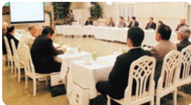
②日 時 平成22年 5月14日 11時半より 場 所 カルチェドシャンブリアン 出席者 総代22名 信用組合役職員11名