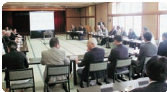
④日 時 平成22年 5月19日 11時半より 場 所 吹の湯旅館 出席者 総代23名 信用組合役職員21名